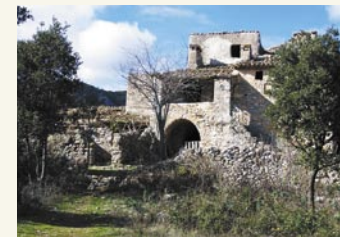
La bergerie de l'Estagnol, au Sud-Est du Roc de la Vigne

Revenons à nos moutons! Tout dans les noms de lieux nous ramène au mouton : bergerie de l'Estagnol, col du Berger, Grotte des moutons... Le nom même du hameau des Lavagnes indique la présence des points d'eau aménagés pour abreuver les moutons (lavogne). De nombreuses mares sont disséminées sur le territoire : la Rigoule, la Roubie, le Lac neuf... Les moutons qui parcourent ces paysages maintiennent encore une belle garrigue rase. Vous ne les verrez cependant pas de juin à septembre car ils partent en transhumance.